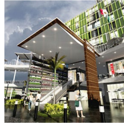
· Plaza Comercial Galerías Mérida