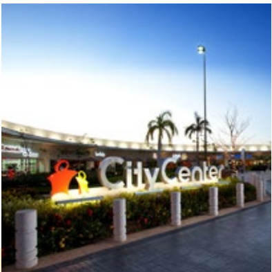
· Plaza Comercial City Center