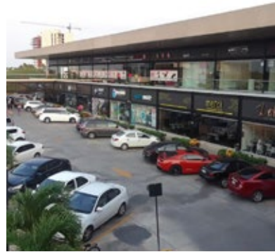
· Plaza Comercial San Angelo