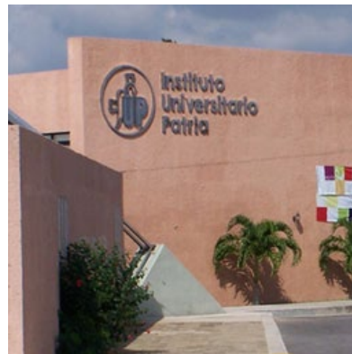
· Instituto Universitario Patria