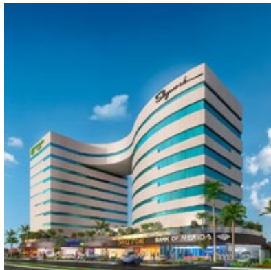
· Oficinas corporativas SkyWork