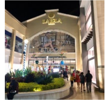
· Plaza Comercial La Isla Mérida