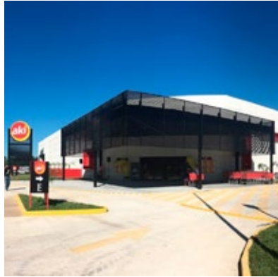
· Supermercado Súper Akí