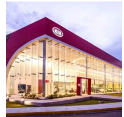
· Kia Norte Mérida