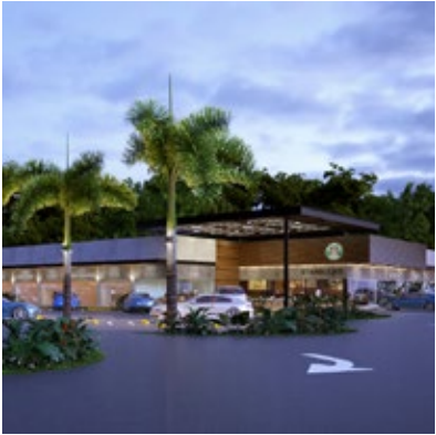
· Plaza Verona