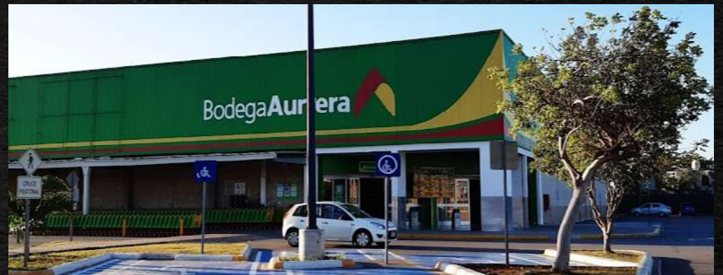
· Bodega Aurrer6 Quetzalc6atl