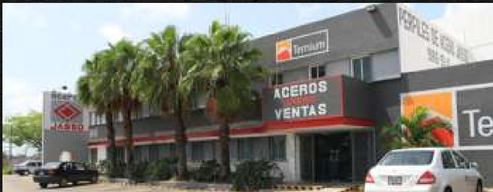
· Aceros Jasso Tienda Matriz Misn6