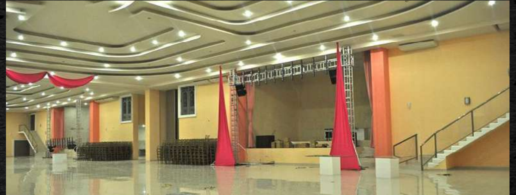
· Sal6n de Fiestas Grand Versailles