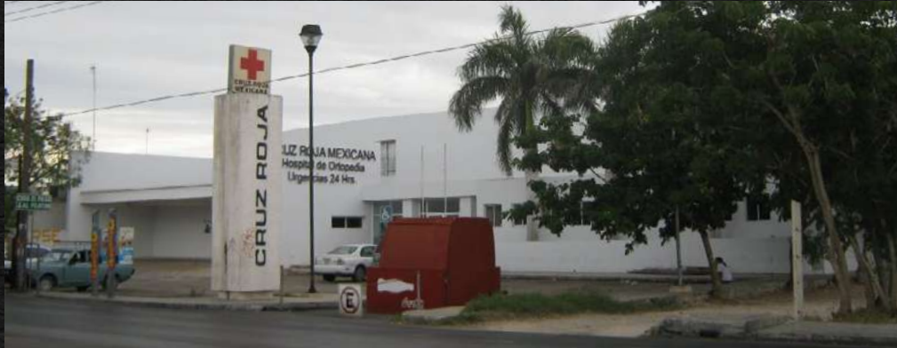
· Cruz Roja Mexicana Hospital de Ortopedia